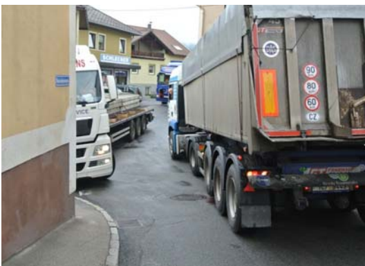
Realisierung Umfahrung Peilstein