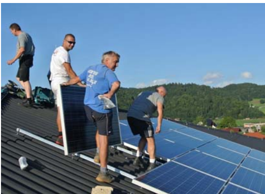
Klimaschutz durch energiesparende Maßnahmen